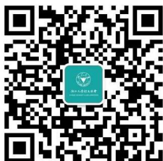
浙江大学校友总会 (zjuer1897)